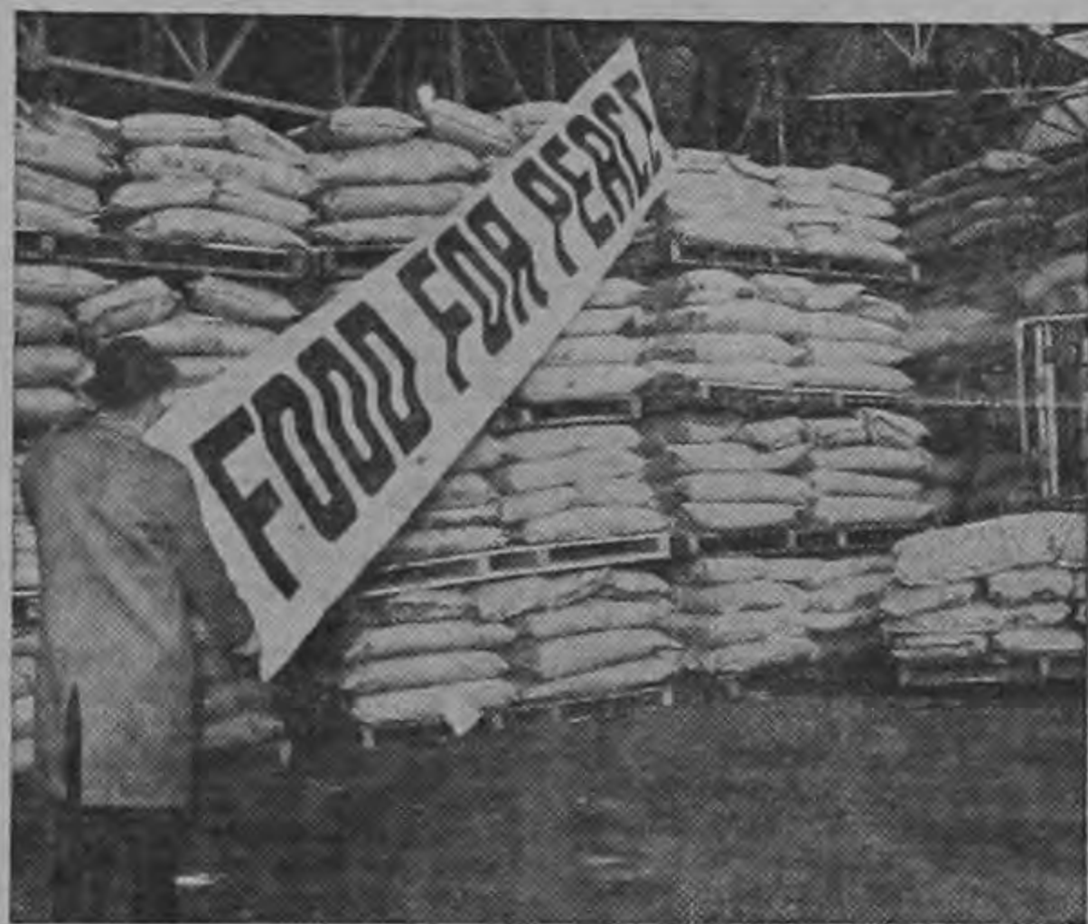
ALIMENTOS PARA LA PAZ listos para ser distribuidos bajo el programa de Alianza para el Progreso

Diez y seis naciones latinoamericanas han firmado convenios de garantía para las inversiones, con los Estados Unidos, bajo los cuales los inversionistas están asegurados contra ciertas pérdidas que puedan derivarse de las inversiones he-